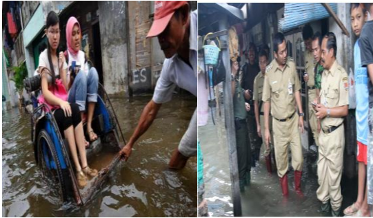
Sumber : Badan Penanggulangan Bencana Daerah, 2013