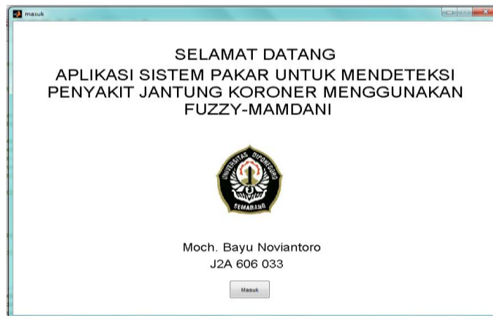
Gambar 2.2 Form - Pembuka

Aplikasi sistem pakar deteksi PJK pada tugas akhir ini dibuat dengan menggunakan program Matlab 7.10.0.499 (R2010a). Antarmuka dalam aplikasi ini terbagi menjadi dua bagian yaitu form pembuka dan form aplikasi.