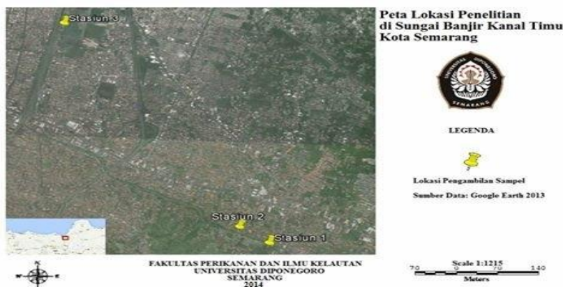
Gambar 1. Peta Lokasi Penelitian di Sungai Banjir Kanal Timur, Semarang