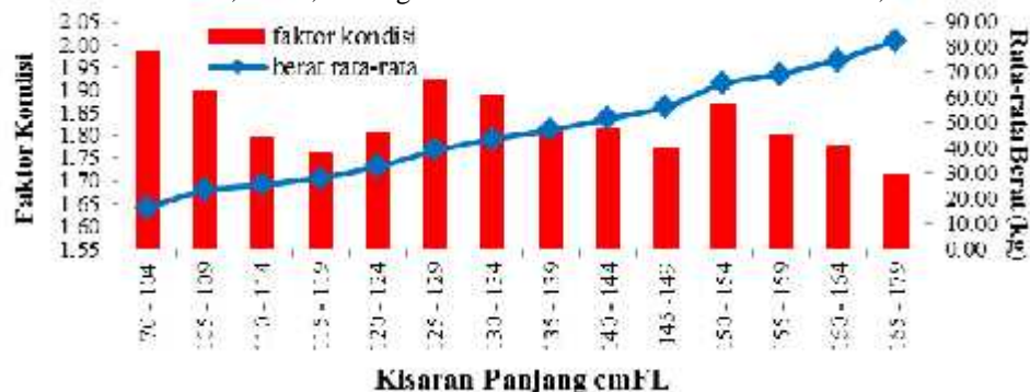
Gambar 3. Faktor kondisi ikan madidihang yang didaratkan di Pelabuhan Benoa Bulan April – Mei 2016

Sebaran faktor kondisi ikan madidihang selama kegiatan penelitian disajikan pada (Gambar 3). Sebanyak 573 ekor diperoleh nilai K antara 1,71 – 1,99 dengan rata-rata nilai faktor kondisi adalah 1,83.