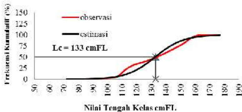
Gambar 4. Grafik Lc Ikan Madidihang yang Didaratkan di Pelabuhan Benoa Bali bulan April – Mei 2016

Hasil perhitungan ukuran pertama kali tertangkap ikan Madidihang diperoleh ukuran sebesar 133 cmFL. Ukuran terkecil ikan madidihang yang tertangkap pada penelitian ini panjang 70 cmFL dan ukuran terpanjang yaitu 178 cmFL. (Gambar 4).