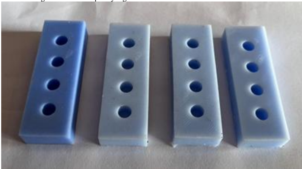
Gambar 1. Molding solvent casting

Dalam penelitian kali ini metode pembuatan gelatin/ hidroksiapatit cangkang kerang hijau dengan fraksi berat total 4 gram dengan komposisi 5% gelatin :95% HA, serta dilakukan penambahan air 4,5 ml untuk pelarutan gelatin. Metode yang digunakan pada penelitian ini adalah metode solvent casting . Diawali dengan melarutkan gelatin sesuai komposisi dalam 4,5 ml aquades pada suhu 60^\circ\text{C} dalam gelas beaker hingga larut sempurna menggunakan hand mixing selama 5 menit. Setelah gelatin sudah larut sempurna dengan aquades, tuangkan larutan gelatin ke mortar bersamaan dengan hidroksiapatit sesuai dengan komposisi. Gelatin/ hidroksiapatit yang sudah dituangkan ke mortar, kemudian ditumbuk secara perlahan agar dapat tercampur sempurna. Setelah fasa homogen, kemudian campuran gelatin hidroksiapatit dimasukkan menggunakan spatula ke dalam molding yang terbuat dari silikon, molding berukuran 6\text{ mm} \times 6\text{ mm} . Diamkan pada suhu ruang selama 15 menit, kemudian keringkan pada suhu 40^\circ\text{C} menggunakan oven selama 24 jam sampai mengeras. Lalu dilakukan beberapa pengujian seperti FTIR, densitas, kekerasan, laju degradasi, dan porositas untuk mengetahui karakteristik gelatin hidroksiapatit yang dihasilkan.