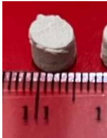
Gambar 2. Produk bone graft gelatin/hidroksiapatit