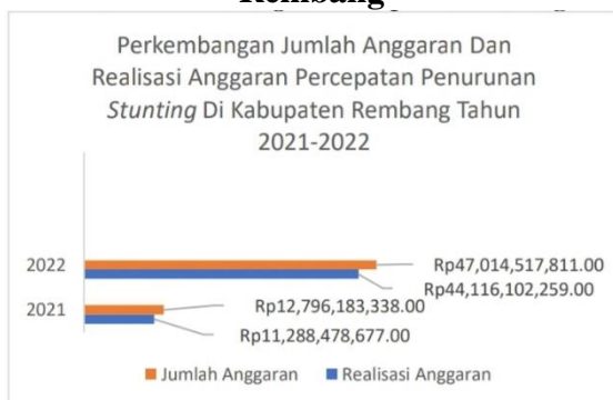
Gambar 1.4 Perkembangan Anggaran Dan Realisasi Anggaran Percepatan Penurunan Stunting Di Kabupaten Rembang