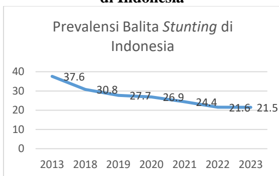
Gambar 1.1 Prevalensi Balita Stunting di Indonesia