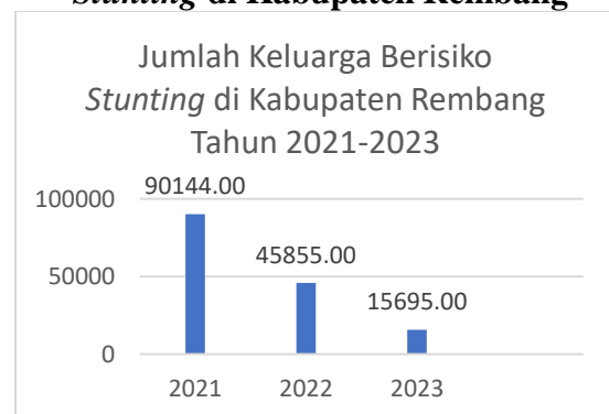
Gambar 1.3 Jumlah Keluarga Berisiko Stunting di Kabupaten Rembang