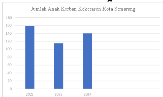
Gambar 3. Jumlah Anak Korban Kekerasan Kota Semarang

Jumlah korban kekerasan anak di Kota Semarang mengalami fluktuatif dalam kurun waktu 2022 hingga 2024. Hal ini menunjukkan bahwa yang seharusnya penghargaan Kota Layak Anak Kategori Utama yang didapatkan pada tahun 2023 dapat menggambarkan keberhasilan Pemerintah Kota Semarang dalam menekan kasus kekerasan terhadap anak. Namun, kenyataan di lapangan menunjukkan bahwa penghargaan tersebut belum sepenuhnya mencerminkan keberhasilan perlindungan nyata terhadap anak-anak.