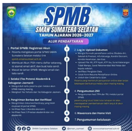
Gambar 3.1 SPMB SMAN Sumatera Selatan