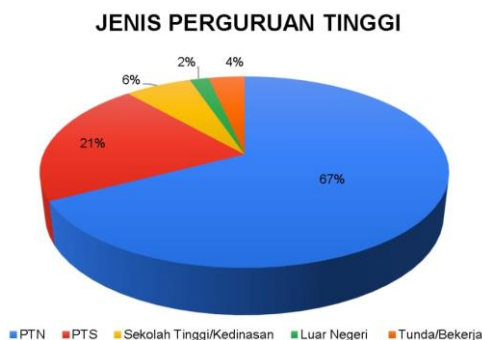
Gambar 1. 2 Sebaran Jenis Perguruan Tinggi Alumni