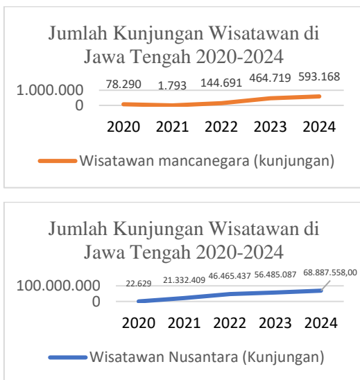
Gambar 1. Jumlah Kunjungan

Di Indonesia, sektor pariwisata merupakan pilar pembangunan ekonomi nasional. Pemerintah menargetkan peningkatan kontribusi pariwisata terhadap PDB melalui pengembangan destinasi wisata unggulan, termasuk desa wisata (Hasibuan dkk., 2023). Menurut data Kementerian Pariwisata dan Ekonomi Kreatif (Kemenparekraf), terjadi fluktuasi jumlah wisatawan yang berkunjung ke Indonesia antara Tahun 2020-2024.