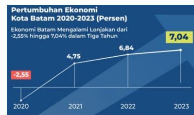
Gambar 1. Pertumbuhan Ekonomi di kota Batam 2020-2023

jasa baik di tingkat nasional maupun internasional. Kedekatannya dengan Singapura dan Malaysia menjadikan Batam sebagai kawasan ekonomi khusus yang pertumbuhannya sangat pesat. Berdasarkan data Badan Pusat Statistik Kota Batam (2024), laju pertumbuhan ekonomi Batam pada tahun 2023 mencapai sekitar 7–8%, melampaui rata-rata pertumbuhan ekonomi nasional. Pertumbuhan tersebut ditopang oleh sektor industri manufaktur, logistik, pariwisata, serta peningkatan investasi asing.