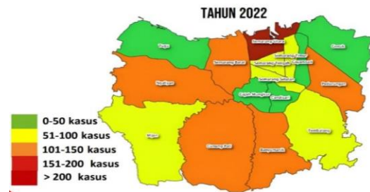
Gambar 1.2 Persebaran Kasus Stunting Kota Semarang Tahun 2022

wilayah tersebut masih sangat tinggi dengan total lebih dari 200 anak terindikasi stunting.