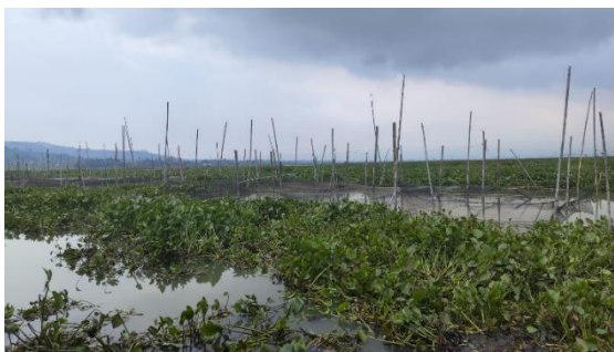
Gambar 4. Kondisi Eceng Gondok di Rawa Pening

masyarakat melalui Bengkok Craft di Desa Kesongo. Melimpahnya eceng gondok di kawasan Rawa Pening menyediakan bahan baku yang mudah diakses tanpa prosedur birokrasi yang rumit, didukung penuh oleh pemerintah desa yang justru mendorong masyarakat untuk memanfaatkannya sebagai bagian dari upaya pengendalian gulma sekaligus revitalisasi kawasan rawa. Pemanfaatan eceng gondok ini membuka peluang ekonomi nyata bagi warga, baik melalui pengolahan menjadi produk kerajinan bernilai tinggi melalui Bengkok Craft maupun dijual dalam bentuk bahan mentah, sehingga menciptakan sumber pendapatan alternatif yang mampu menopang stabilitas ekonomi keluarga pengrajin secara berkelanjutan.