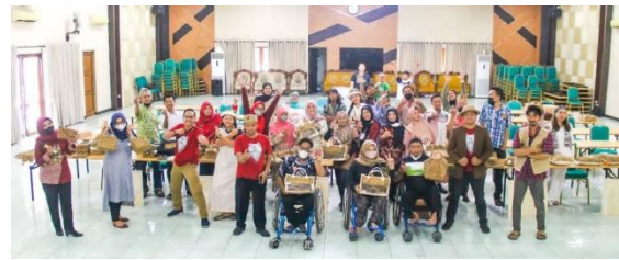
Gambar 6. Pelatihan Bersama Para Pengrajin Bengok Craft

Selain fasilitas fisik, fasilitas nonfisik berupa pelatihan dan pengembangan usaha turut berperan dalam meningkatkan keterampilan dan motivasi pengrajin, sebagaimana tergambar pada dokumentasi berikut.