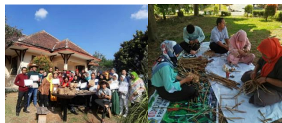
Gambar 3. Pelatihan dari Disperindag di Kampoeng Kopi Banaran

Pada tahap pengkapasitasan, Pemerintah Desa Kesongo melalui Bengok Craft melakukan penguatan kapasitas masyarakat secara menyeluruh yang mencakup tiga aspek utama. Pengkapasitasan manusia dilakukan melalui pelatihan berbasis praktik langsung yang berhasil mengubah warga dari tidak berkeahlian menjadi pengrajin terampil. Sebagaimana terlihat pada gambar berikut.