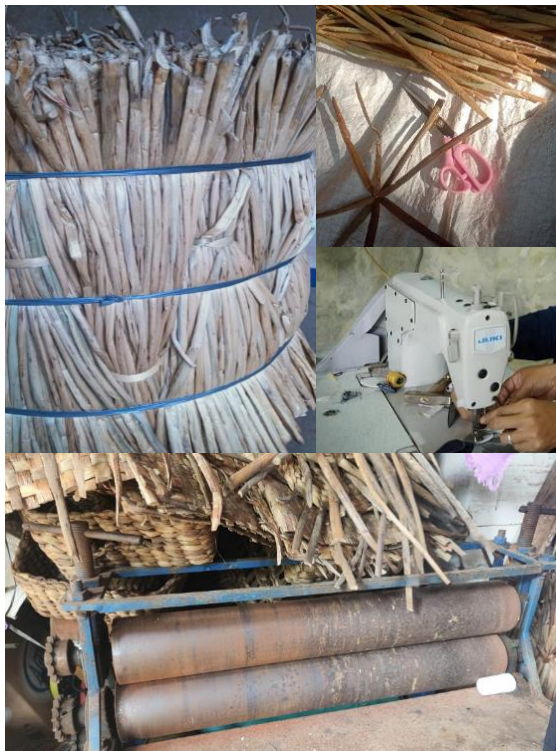
Gambar 5. Alat dan Bahan Produksi Bengok Craft

Faktor sarana dan prasarana menjadi pendukung dalam pemberdayaan masyarakat melalui Bengok Craft di Desa Kesongo. Fasilitas fisik berupa alat produksi sederhana seperti alat pres, mesin jahit, gunting, serta bahan baku eceng gondok telah mendukung proses pembuatan kerajinan berbasis keterampilan tangan, sebagaimana terlihat pada gambar berikut.