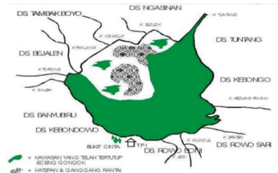
Gambar 2. Daerah Tertutup Tanaman Eceng Gondok

dari sisi lingkungan maupun perekonomian masyarakatnya.