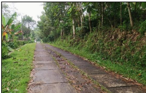
Gambar 2. Jalan Dusun di Desa Ngadimulyo

berlubang dan licin untuk dilalui ketika musim hujan.