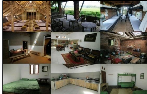
Gambar 3. Homestay Tambujatra

warga yang bersedia menyewakan kamarnya kepada pengunjung.