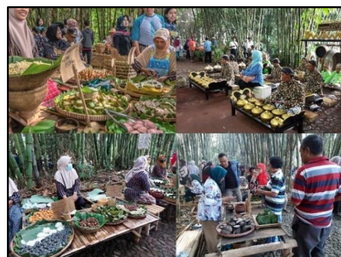
Gambar 1. Pasar Papringan Ngadiprono

Salah satu desa wisata yang ada di Kabupaten Temanggung adalah Desa Wisata Ngadimulyo, Kecamatan Kedu, Kabupaten Temanggung. Desa Wisata Ngadimulyo terdiri dari 10 (sepuluh) dusun, yaitu Dusun Setrobayan, Ngliwu, Gintung, Craken, Ngadidono, Ngadiprono, Dadapan, Ngleri, Pager Gunung dan Krincing. Dusun Ngadiprono merupakan dusun daya tarik wisata terkenal, yaitu Pasar Papringan Ngadiprono.