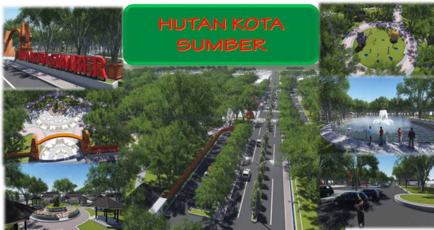
Gambar 2.1 Desain Pembangunan Sarana dan Prasarana Hutan Kota Sumber

Sumber: Arsip Dinas Cipta Karya dan Tata Ruang Kabupaten Cirebon Tahun 2014