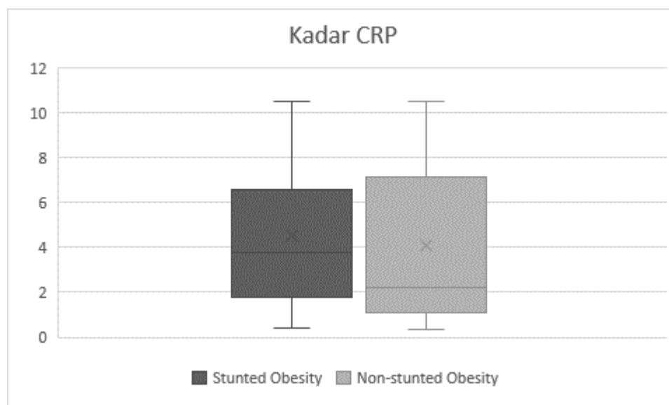
Gambar 1. Distribusi kadar High Sensitive C-Reactive Protein (hsCRP) pada Kelompok Stunted Obesity dan Non-stunted Obesity

4,51 mg/l sedangkan kelompok Non-stunted Obesity adalah 4,05 mg/l. Rerata kadar hsCRP pada kelompok Stunted Obesity lebih tinggi dibandingkan dengan rerata kadar hsCRP pada kelompok Non-stunted Obesity .