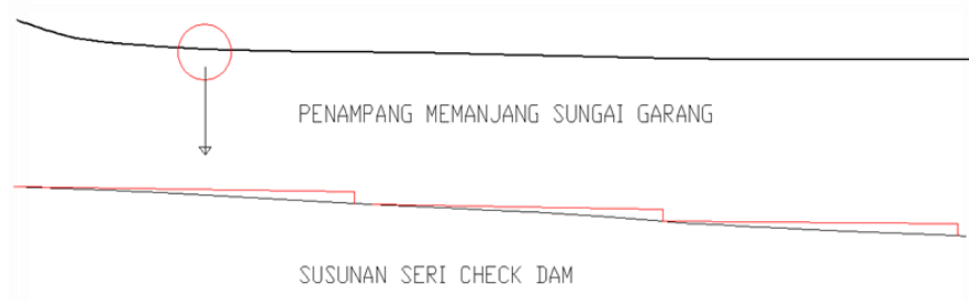
Gambar 1. Penampang memanjang Sungai Garang dan Susunan Seri Check Dam

Analisa Hidrologi memerlukan data berupa : peta situasi, peta topografi, data tanah, data curah hujan pada DAS tersebut, dan lain-lain. Data-data ini didapat dari berbagai sumber. Berikut merupakan contoh data yang berupa peta Situasi, peta Das Garang, penampang memanjang sungai. Sedangkan alir perencanaan Check Dam dapat dilihat pada gambar 3.