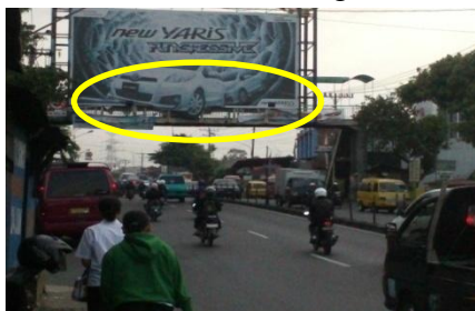
Gambar 5.4 Lokasi Pemasangan Rambu (Arah Yogja / Solo)