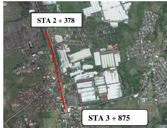
Gambar 5.5 Lokasi Penempatan Barrier Atau Pagar Median

Mengacu pada UU 22 tahun 2009 pasal 25 tentang penggunaan dan perlengkapan jalan dimana setiap jalan yang digunakan untuk lalu lintas umum wajib dilengkapi dengan perlengkapan jalan untuk keselamatan dan kenyamanan pengguna jalan. Salah satu permasalahan yang terdapat pada Jalan Soedirman adalah selain penyeberang tidak pada jembatan, dan juga banyak dijumpai kendaraan yang memutar ( U - Turn ). Maka dalam menertibkan perputaran kendaraan di depan Pasar Babadan Ungaran dilakukan pemasangan barrier pada median Jalan Jend. Soedirman. Pemasangan barrier ini juga bermanfaat untuk menghalangi pejalan kaki menyeberang jalan tidak pada tempatnya ( jembatan penyeberangan ). Perencanaan titik peletakan barrier dapat dilihat di gambar berikut :