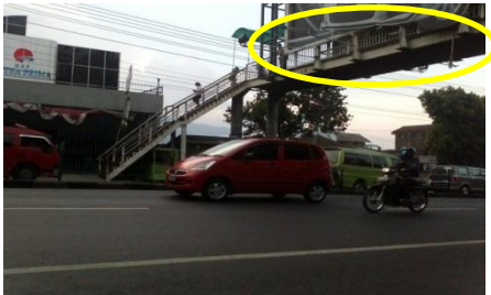
Gambar 5.3 Lokasi Pemasangan Rambu (Arah Semarang)

desain rambu pemasangannya sebagai berikut :