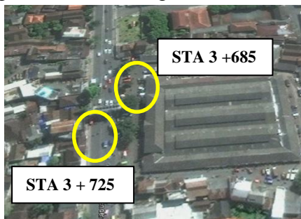
Gambar 5.8 Rencana Perletakan Shelter