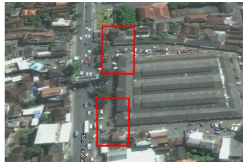
Gambar 5.10 Lokasi Rencana Pelebaran Jalan Masuk dan Keluar Pasar

Gambaran kondisi untuk perencanaan tersebut adalah sebagai berikut :