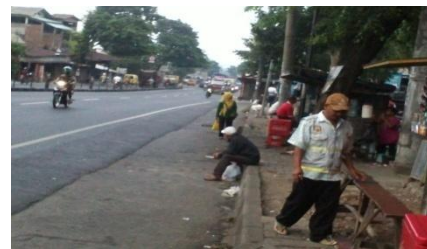
Gambar 5.2 Kondisi Trotoar di Jln. Jend. Soedirman

digunakan sebagai lahan pedagang kaki lima. Toko, dan pedagang kaki lima tersebut menyebabkan adanya kecenderungan kendaraan yang menepi ke pinggir jalan / parkir di pinggir jalan. Banyaknya kendaraan yang menepi dan para pejalan kaki yang berjalan di bahu jalan mengakibatkan suatu hambatan pada pengguna jalan lainnya.