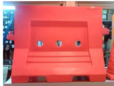
Gambar 5.6 Road Barrier ( Water Block )

Jenis dari barrier yang dipasang adalah Road Barrier ( Water Block ) dengan lebar 50 cm, panjang 100 cm, tinggi 80 cm, dan berat 15 kg / buah. Barrier jenis ini berbahan plastik yang dapat di isi air atau pasir sehingga ramah lingkungan. Jenis barrier yang dipasang seperti terlihat pada Gambar 5.6.