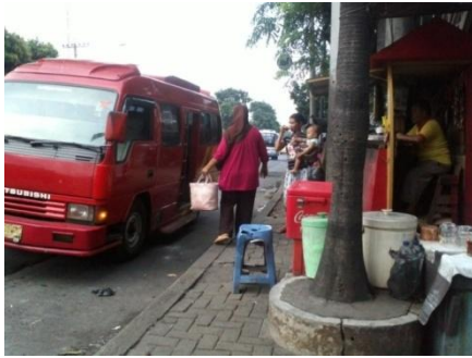
Gambar 5.7 Kondisi Pemberhentian Bus

maka dibuat sebuah pemecahan permasalahan dengan membuat teluk dan shelter . Shelter yang ditentukan berjumlah 2, lokasi penempatan shelter sebagai berikut :