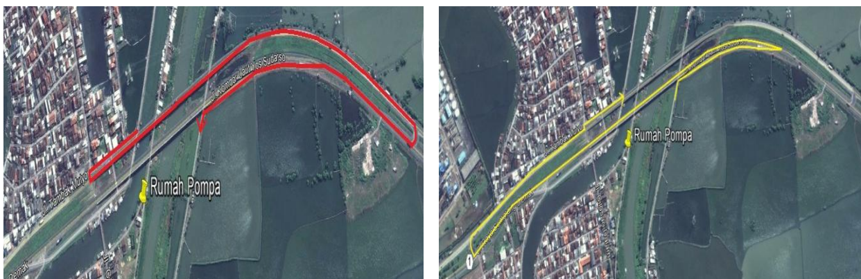
Gambar 4 : Rute hauling tanggul penutup melalui jalan arteri