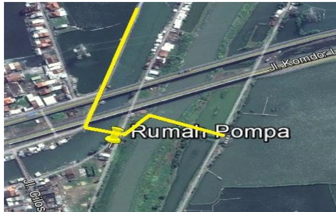
Gambar 5 : Rute hauling tanggul penutup melalui jembatan bailey

Berdasarkan analisa pekerjaan yang mungkin untuk dilakukan dalam pelaksanaan pembangunan sistem polder Kali Banger ini, menghasilkan beberapa kombinasi pekerjaan sebagai alternatif yang akan dibanding untuk mendapatkan metode pelaksanaan yang paling efektif. Alternatif pelaksanaan ini meliputi :