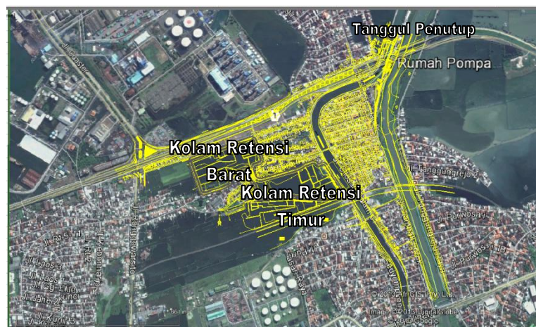
Gambar 1 : Lokasi Sistem Polder Kali Banger

Sistem Drainase Polder Banger yang terletak di Kecamatan Semarang Timur secara administrasi mempunyai wilayah yang terdiri atas beberapa kelurahan antara lain Bugangan, Karangtempel, Karangturi, Kebonagung, Kemijen, Mlatibaru, Mlatiharjo, Rejomulyo, Rejosari, Sarirejo dan Kecamatan Semarang Utara yaitu Tanjung Emas.