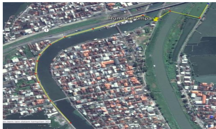
Gambar 3 : Rute hauling kolam retensi melalui jembatan bailey