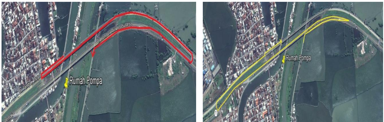
Gambar 2 : Rute hauling kolam retensi melalui jalan arteri