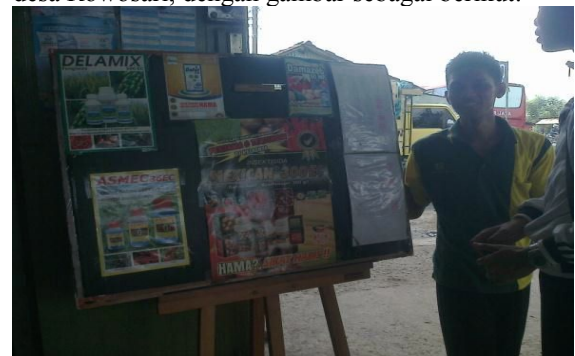
Gambar 3. Mading Toko Obat

Hal tersebut didukung dengan adanya gambar yang diperoleh peneliti pada saat melakukan observasi di desa Rowosari, dengan gambar sebagai berikut: