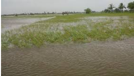
Gambar 2. Banjir yang Menggenangi Sawah di Desa Rowosari

Hal tersebut didukung dengan adanya gambar yang diperoleh peneliti pada saat melakukan observasi di desa Rowosari, dengan gambar sebagai berikut: