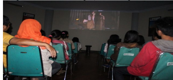
Gambar 4. Kegiatan menonton film bareng di Kantor Perpustakaan dan Arsip Daerah Kota Salatiga (Dokumen peneliti, 2015)