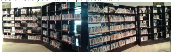
Gambar 1. Rak koleksi Kantor Perpustakaan dan Arsip Daerah Kota Salatiga (Dokumen peneliti, 2015)

Berikut adalah gambaran suasana sarana rekreasi yang ada di Kantor Perpustakaan dan Arsip Daerah Kota Salatiga. Sarana rekreasi tersebut yaitu koleksi, layanan anak, layanan internet, layanan audiovisual, dan taman perpustakaan.