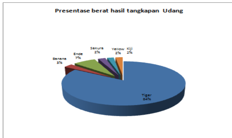
Gambar 1. Grafik hasil tangkapan Udang

Berdasarkan data hasil tangkapan pukat udang dapat dilihat bahwa hasil tangkapan dari alat tangkap pukat udang adalah udang Tiger, udang Banana, udang Ende, Udang Sakura, udang Yellow, dan udang Kiji. Hasil terbanyak adalah udang Tiger ( Penaeus semisulcatus ) sebanyak 84 % dengan berat 1911 kg, presentase kedua yaitu udang Ende ( Metapenaeus sp. ) dengan berat 156 kg 7% dari berat total. Udang Banana ( Penaeus merguensis ) 3% (62 kg), udang Sakura ( Metapenaeus ensis ) 2% (52 kg), udang Yellow ( Latisucatus sp. ) 2% (46 kg), dan udang Kiji ( Metapenaeus eboracensis ) 2% (50 kg).