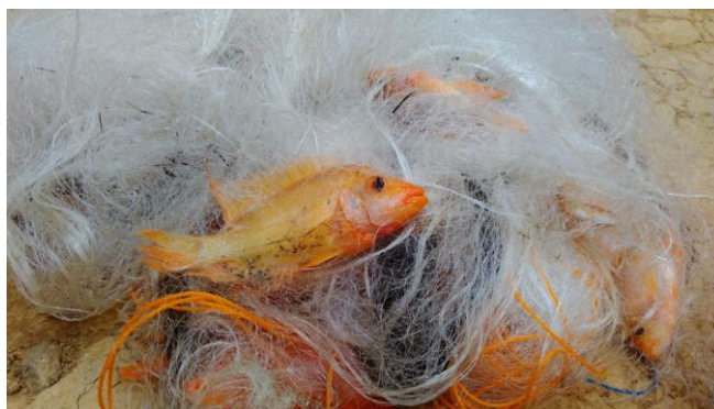
Gambar 3. Ikan red devil yang tertangkap jaring insang

Efisiensi gill net ditentukan oleh hanging ratio dan shortening (nilai pengerutan) pada tali pelampung dan tali pemberat, gaya apung ( buoyancy ) dan gaya tenggelam ( sinking power ) yang bekerja pada jaring. Hal itu memegang peranan penting dalam menentukan atau mempertahankan keberadaan jaring di kolom air pada saat operasi penangkapan berlangsung, karena mempengaruhi ketegangan pada setiap mata jaring, yang dengan sendirinya berpengaruh pada kemampuan jerat jaring. Selain itu kedua gaya vertikal yang bekerja yaitu gaya apung dan khususnya gaya tenggelam dapat menentukan laju tenggelamnya jaring hingga secara tidak langsung mempengaruhi lamanya waktu operasi.