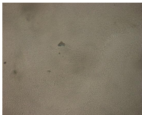
Gambar 2. Motilitas massa kategori baik (++) dengan perbesaran 10x10