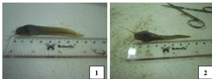
Gambar 3. Gejala Klinis Ikan Lele ( Clarias sp. ) yang Terinfestasi Monogenea: (1) Sirip Dada Geripis Memerah, Sirip Punggung Geripis Memerah, Sirip Ekor Geripis Memerah dan Sungut Patah, (2) Warna insang Pucat