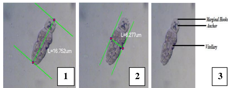
Gambar 5. Morfometrik Parasit Gyrodactylus spp. yang Menginfestasi Ikan Nila, Ikan Mas dan Ikan Lele : (1) Panjang Tubuh Gyrodactylus spp., (2) Lebar Tubuh Gyrodactylus spp., (3) Bagian-bagian Tubuh Gyrodactylus spp.

Genus Dactylogyrus masuk ke dalam kingdom Animalia, filum Platyhelminthes, klas Monogenoidea, ordo Dactylogyridea, family Dactylogyridae dan genus Dactylogyrus . Dactylogyrus diketahui telah menginfestasi ikan nila ( O. niloticus ), ikan mas ( C. carpio ) dan ikan lele ( Clarias sp.) dalam pengamatan diketahui memiliki bagian mata pada bagian tubuh anterior dan marginal hooks yang menempel pada insang. Panjang tubuh Dactylogyrus adalah 61,036µm dan lebar 8,944µm. Bentuk tubuh dari Dactylogyrus adalah fusiform .