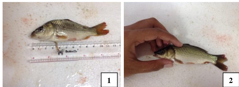
Gambar 2. Gejala Klinis Ikan Mas ( C. carpio ) yang Terinfestasi Monogenea : (1) Sirip Ekor Geripis Memerah, Sirip Anus Geripis Memerah dan Sirip Dada Geripis Memerah, (2) Produksi Lendir Berlebihan