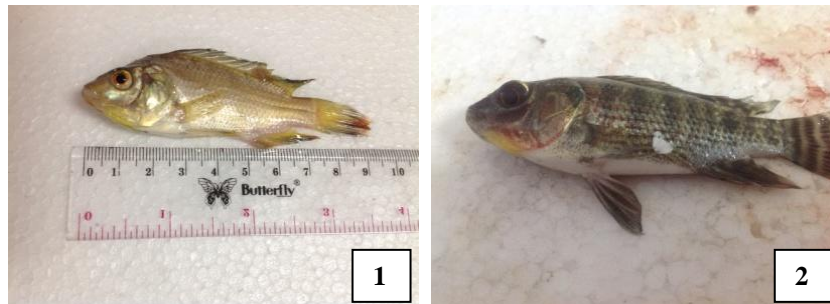
Gambar 1. Gejala Klinis Ikan Nila ( O. niloticus ) yang Terinfestasi Monogenea : (1) Sirip Ekor dan Anus Geripis Memerah, (2) Produksi Lendir Berlebihan

Jumlah ikan yang diamati adalah 90 ekor dan 68 ekor ikan terinfestasi monogenea. Gejala klinis ikan nila ( O. niloticus ), ikan mas ( C. carpio ), dan ikan lele ( Clarias sp. ) yang diamati dalam penelitian ini hampir sama yaitu sirip ekor, anus, punggung dan dada geripis memerah. Pada ikan nila ( O. niloticus ) adalah produksi lendir berlebihan dan terdapat jamur pada sirip punggung (Gambar 1). Gejala klinis khusus yang terlihat pada ikan mas ( C. carpio ) adalah produksi lendir berlebihan (Gambar 2). Gejala klinis khusus yang terlihat pada ikan lele ( Clarias sp. ) adalah sungut patah dan warna insang pucat (Gambar 3).