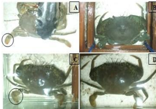
Gambar 3. Gejala Klinis yang Terlihat Pasca Perendaman Ekstrak Daun Jeruju ( A. ilicifolius ). A. Warna Kaki Renang Normal; B. Warna Karapas Normal; C. Kaki-kaki Tidak Merenggang; dan D. Bercak Coklat Memudar

Gejala klinis pasca penyuntikan V. harveyi sebelum dilakukan perendaman ekstrak daun jeruju yaitu kaki renang berwarna merah, kaki-kaki merenggang, karapas menghitam dan muncul bercak coklat pada karapas. Gejala klinis setelah dilakukan perendaman ekstrak daun jeruju yaitu warna merah pada kaki renang memudar, kaki-kaki sudah tidak merenggang, warna karapas kembali normal dan bercak coklat pada karapas mengecil.