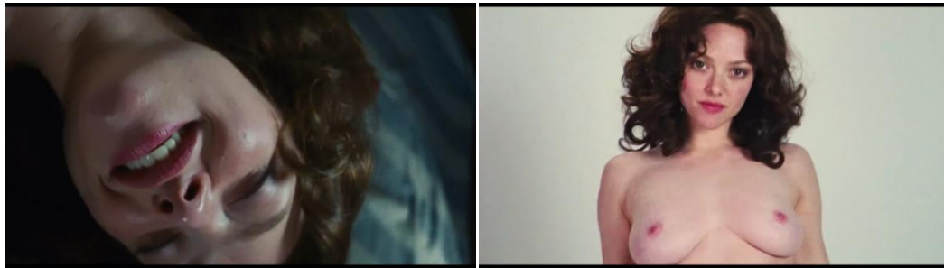
Gambar 1.2 Gambaran fragmentasi dalam film Lovelace

Linda, fragmentasi-fragmentasi yang menunjukkan bagaimana perempuan dilihat oleh penonton menggunakan male gaze , dan lain-lain.