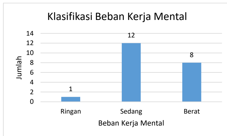
Gambar 1. Klasifikasi Beban Kerja Mental

Berdasarkan skor yang diperoleh, dapat diketahui bahwa 8 orang (38,10%) karyawan memiliki beban kerja mental yang tinggi, 12 orang (57,14%) memiliki beban kerja mental sedang, dan 1 orang (4,76%) memiliki beban kerja mental ringan. Hal ini menunjukkan sebagian besar karyawan pada departemen logistik memiliki beban kerja mental pada tingkat sedang. Karyawan yang memiliki tingkat beban kerja mental berat sebagian besar berada pada bagian scanner dan helper . Tugas scanner yaitu me- scan imei produk sesuai surat jalan dan menghitung serta mencocokkan barang sesuai surat jalan. Helper yang memiliki beban kerja mental tinggi yaitu helper untuk mempersiapkan barang dan helper timbang. Helper timbang bertugas menimbang barang (memastikan barang dalam kondisi baik dan berbobot utuh) yang telah di- scan sesuai surat jalan dan meletakkan barang ke wilayah transit siap muat ekspedisi pengiriman. Sedangkan helper untuk persiapan barang bertugas membongkar barang masuk, memotret kondisi barang, dan menyiapkan barang yang akan