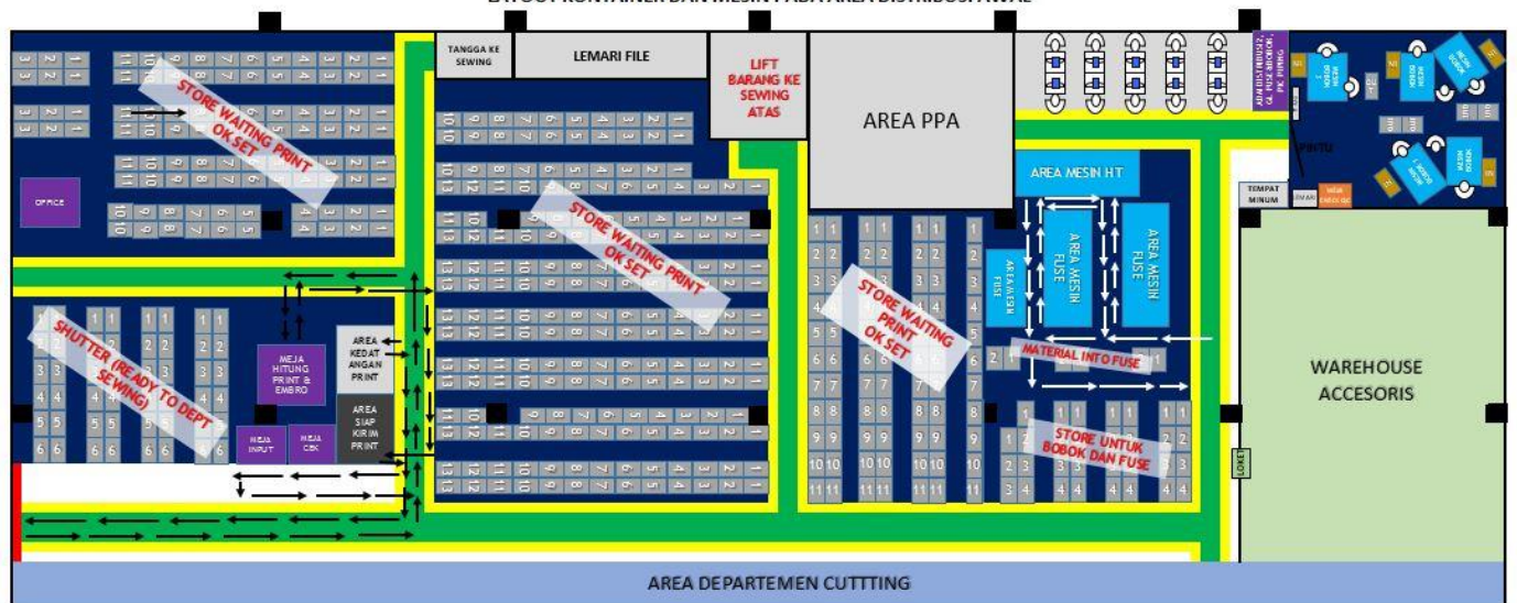
Gambar 2 Layout Departemen Distribusi Awal

Pada gambar 2 panah hitam menunjukkan flow untuk proses print & embro yang ada pada departemen produksi. Sedangkan panah putih menggambarkan flow untuk proses fuse dan juga HT, terlihat aliran yang ada cukup rumit mengingat pengerjaan proses tersebut membutuhkan operator yang tidak sedikit.