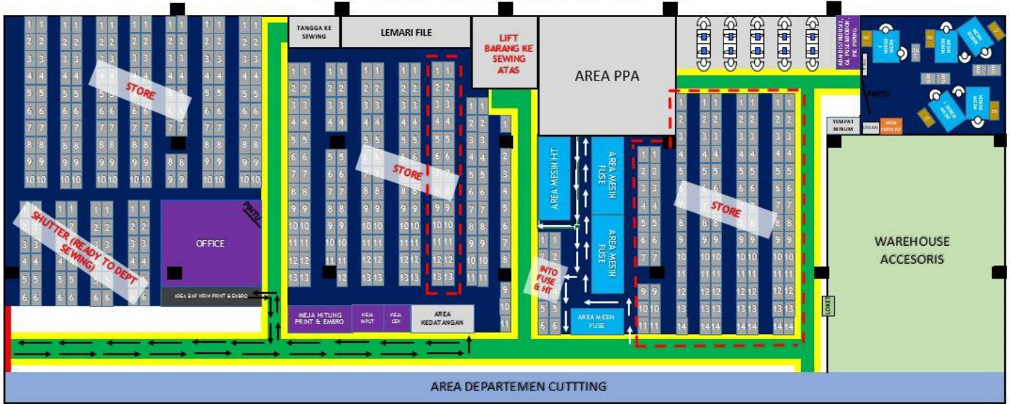
Gambar 3 Layout Area Distribusi Usulan

Penghitungan aisle berdasarkan dimensi trolley yaitu 82 cm x 49 cm x 73 cm yang dapat membawa boks-boks kontainer dengan dimensi 68,7 cm x 47,8 cm x 39 cm. Karena panjang lebar trolley adalah 49 cm dan allowance yang digunakan sebanyak 20% maka lebar aisle diperoleh sebesar 58,8 cm dan dibulatkan menjadi 60 cm. Sebelumnya aisle hanya sebesar sekitar 50 cm.