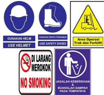
Gambar 3. Peringatan yang dapat digunakan di warehouse

dalam warehouse . Peraturan ini dapat berupa kontrol visual seperti larangan membuang sampah, tidak merokok, dan kewajiban menggunakan alat pelindung diri selama berada di lingkungan warehouse . Pembuatan larangan ini dapat dilakukan dengan membuat rambu-rambu yang bisa dilihat oleh semua pengunjung warehouse dan harus dipatuhi selama berada di area warehouse . Berikut beberapa peringatan yang dapat digunakan di dalam warehouse :