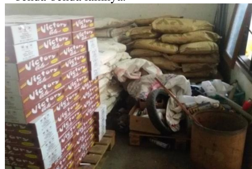
Gambar 1. Material yang tidak digunakan

Seiri merupakan aktivitas yang bertujuan untuk memisahkan peralatan atau material yang tidak diperlukan dengan peralatan atau material yang masih diperlukan. Sehingga akan memberikan space yang lebih besar untuk menyimpan material lain yang masih digunakan. Aplikasi tahapan ini pada warehouse CV Sempurna Moga Makmur belum terlaksana dengan baik, karena masih ada di beberapa sudut bagian dari warehouse yang terdapat tumpukan barang atau material yang tidak digunakan dan seharusnya dapat di letakkan pada bagian luar warehouse . Seperti terlihat pada gambar di bawah ini bahwa masih ada tumpukan barang bekas yang sudah tidak terpakai namun masih disimpan didalam gudang dan ditumpuk secara tidak rapi, yaitu karung bekas, ban bekas dan benda-benda lainnya. Barang-barang yang tidak penting tersebut, tidak hanya yang terdapat di dalam gambar di bawah ini, masih banyak lagi, yaitu kardus bekas packaging, kotak kayu bekas, dan benda-benda lainnya.