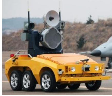
Gambar 5. 1 Birdstrike Machine