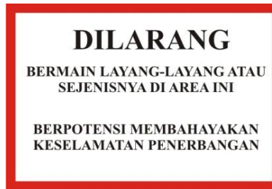
Gambar 3 Contoh Tanda Larangan Bermain Layang-Layang