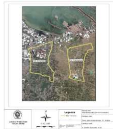
Gambar 1 Lokasi penelitian

Citra Satelit Resolusi Tinggi Kota Semarang tahun 2010, batas administrasi Kota Semarang tahun 2015, data digitalisasi SU dan data fisik SU dari BPN Kota Semarang. Lokasi penelitian dapat dilihat pada gambar 1 berikut.