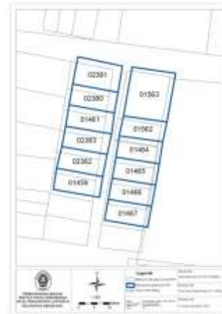
Gambar 3 Hasil perbandingan bidang pada Kelurahan Genuksari

02381 yaitu -2,508 m. sedangkan pergeseran titik Y terbesar pada bidang dengan NIB 02383 yaitu -1,593 m.