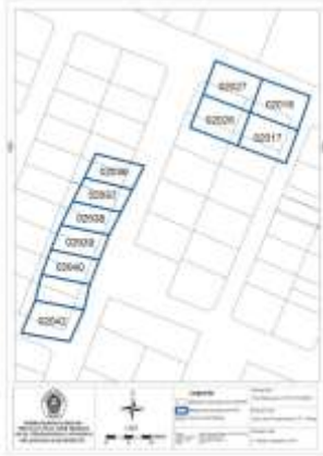
Gambar 4 Hasil perbandingan bidang pada Kelurahan Karangroto

Kemungkinan terjadinya pergeseran yang bernilai negatif dan positif yaitu ketelitian alat saat pengukuran yang kurang. Hal ini bisa disebabkan beberapa hal, antara lain adanya obstruksi yang banyak sehingga sinyal dari satelit tidak dapat menjangkau receiver rover dan sinyal radio dari GPS base untuk koreksi yang terhalang oleh perumahan padat.