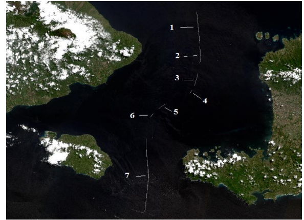
Gambar IV.4. Selisih batas wilayah yang menguntungkan Provinsi Bali menurut garis pangkal lurus dari data citra Sentinel 2