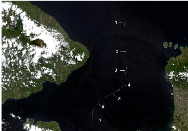
Gambar IV.3. Selisih batas wilayah yang menguntungkan Provinsi Nusa Tenggara Barat menurut garis pangkal lurus dari data citra Sentinel 2