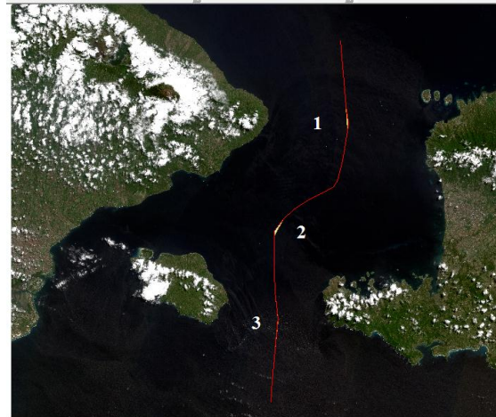
Gambar IV.2. Selisih batas wilayah pada citra Sentinel 2

Pada penggunaan garis pangkal lurus luas daerah yang bertampalan Batas wilayah Provinsi Bali dan Provinsi Nusa Tenggara Barat pada citra Sentinel 2 memiliki perbedaan akibat penggunaan garis pangkal yang berbeda. Selisih luas batas wilayah dapat dilihat pada gambar.