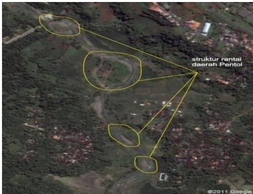
Gambar 2. Struktur daerah Pentol, Tinjomoyo sebagai indikasi sesar aktif (Hidayat dkk, 2011)

terdapat gores garis/striasi (seperti gouge ), banyak rekahan. Di sebelah utara terdapat napal yang terkekarkan, kekar-kekar ini terisi oleh batulempung. Batupasir berwarna coklat dan mempunyai ukuran butir kasar. Batas antara batu pasir dan batu lempung merupakan batas sesar naik. Bidang drag fault adalah N260°E/61°. Sedangkan sebagai bidang detachment adalah batulempung, pada bidang ini terkekarkan sehingga terisi oleh material berukuran pasir kerikil-kerakalan berwarna coklat. Pada batupasir sendiri banyak terdapat rekahan.