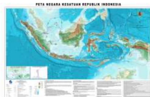
Gambar 3. Peta resmi Negara Kesatuan

Indonesia juga telah menerbitkan sebuah peta resmi pada tahun 2015 sesuai dinamika delimitasi maritimnya.