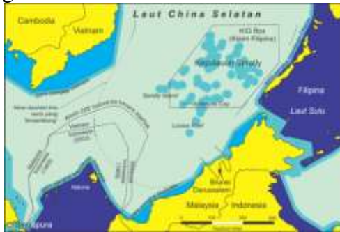
Gambar 4. Peta Klaim Nine Dash Line Tiongkok yang lecehkan visi poros maritim.

Apabila peta resmi Indonesia tahun 2015 (Gambar 3) diaplikasikan dengan peta pemerintah Tiongkok tahun 2009 (lihat: Gambar 2) maka situasinya akan muncul seperti tergambar dalam Gambar nomor 4.