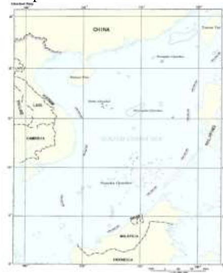
Gambar 2. Peta Nine Dash Line yang diterbitkan Tiongkok pada tahun 2009. 10

Sebagaimana disebutkan diatas, pada tahun 1998 Tiongkok telah menggunakan istilah historis pada Pasal 14 - Exclusive Economic Zone And Continental Shelf Act 9 nya untuk menjustifikasi Penjelasan Hukum terhadap Laut China Selatan.