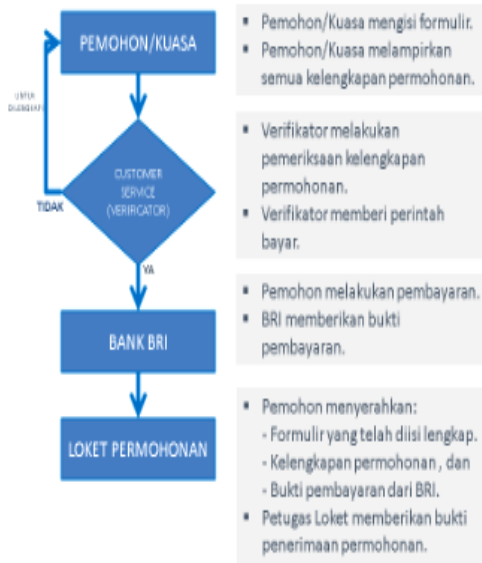
Bagan 1 : Alur Pengajuan Permohonan Ciptaan dalam lingkup Hak Cipta ke Direktorat Jenderal Kekayaan Intelektual (Ditjen KI) Kementerian Hukum dan HAM

Sumber : Buku Panduan Kekayaan Intelektual Direktorat Jenderal Kekayaan Intelektual Kementerian Hukum dan HAM