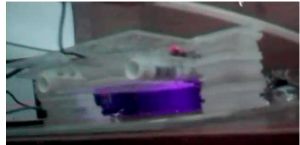
Gambar 2. Plasma korona

elektroda garis, seperti yang ditunjukkan pada Gambar 2. Pada karakterisasi tanpa kain, nilai arus yang ditunjukkan pada tegangan yang hampir maksimum cenderung tidak tentu (acak).